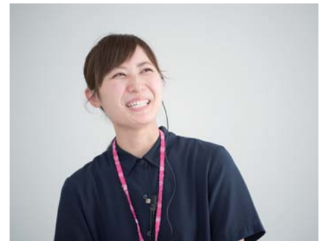
公共施設監視業務