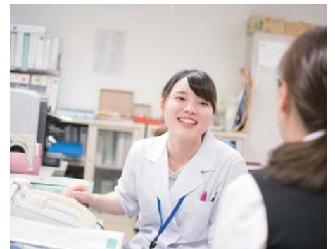
医療サポート業務