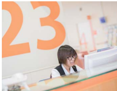
感謝記録管理業務