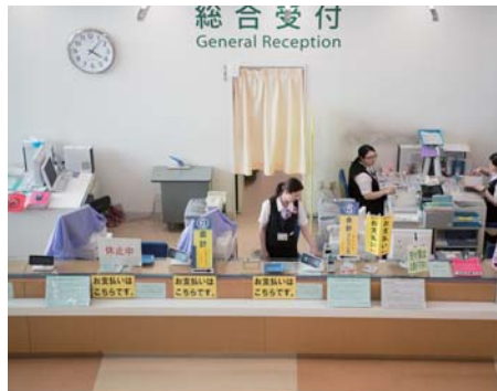
医療機関受付業務