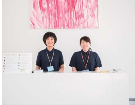
公共施設受付業務