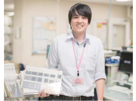
医療事務管理業務